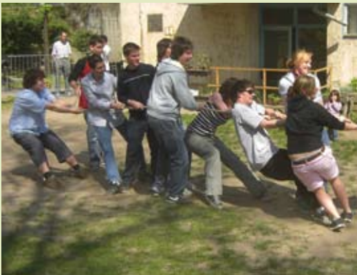
Schüleraustausch mit Ungarn