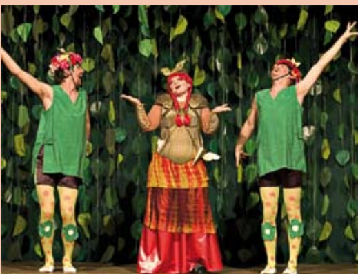
FOS/BOS-Theater „Siegfried - Götterschweiß und Heldenblut“